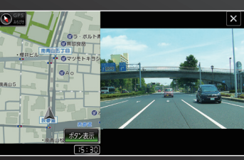
ナビ&バックカメラ

バックカメラ映像を常時表示 バックモニターモードはバックカメラの映像を常時ナビゲーション画面に表示することができる機能です。走行時などに後方確認が難しいトラックなどの車両で、車線変更などの際に、乗用車のルームミラーのように後方を確認することができます。バックカメラ映像とナビゲーションを2画面分割表示が可能です。