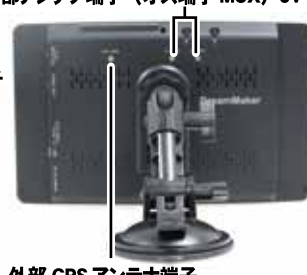
外部 GPS アンテナ端子