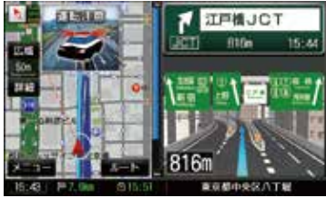
取り締まりポイントアイコン表示