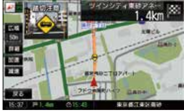
踏み切り案内アイコン表示