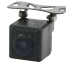
バックカメラケーブル 「PNOP-020」(別売)