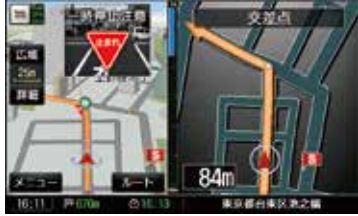
一時停止案内アイコン表示