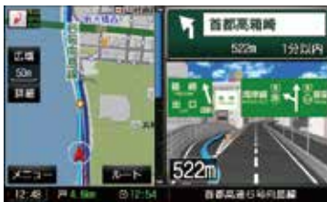
ジャンクション案内