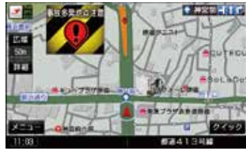
事故多発地点案内