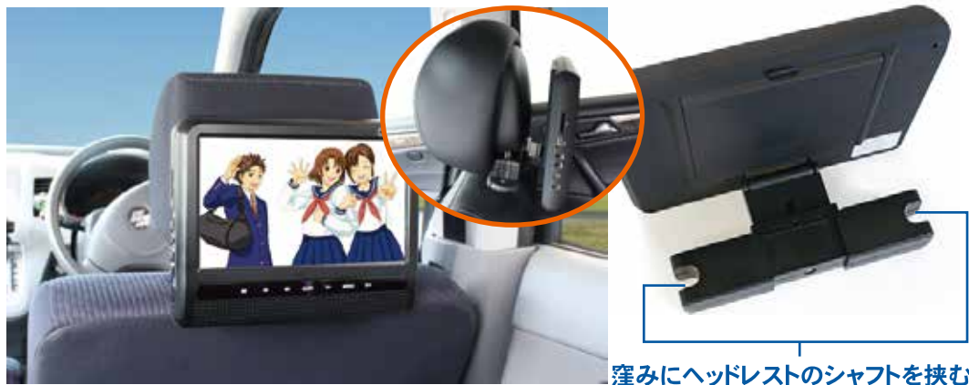
窪みにヘッドレストのシャフトを挟む

スタンド両側が可動式なので、 ヘッドレストのシャフト間隔に合わせて内側から固定できる!