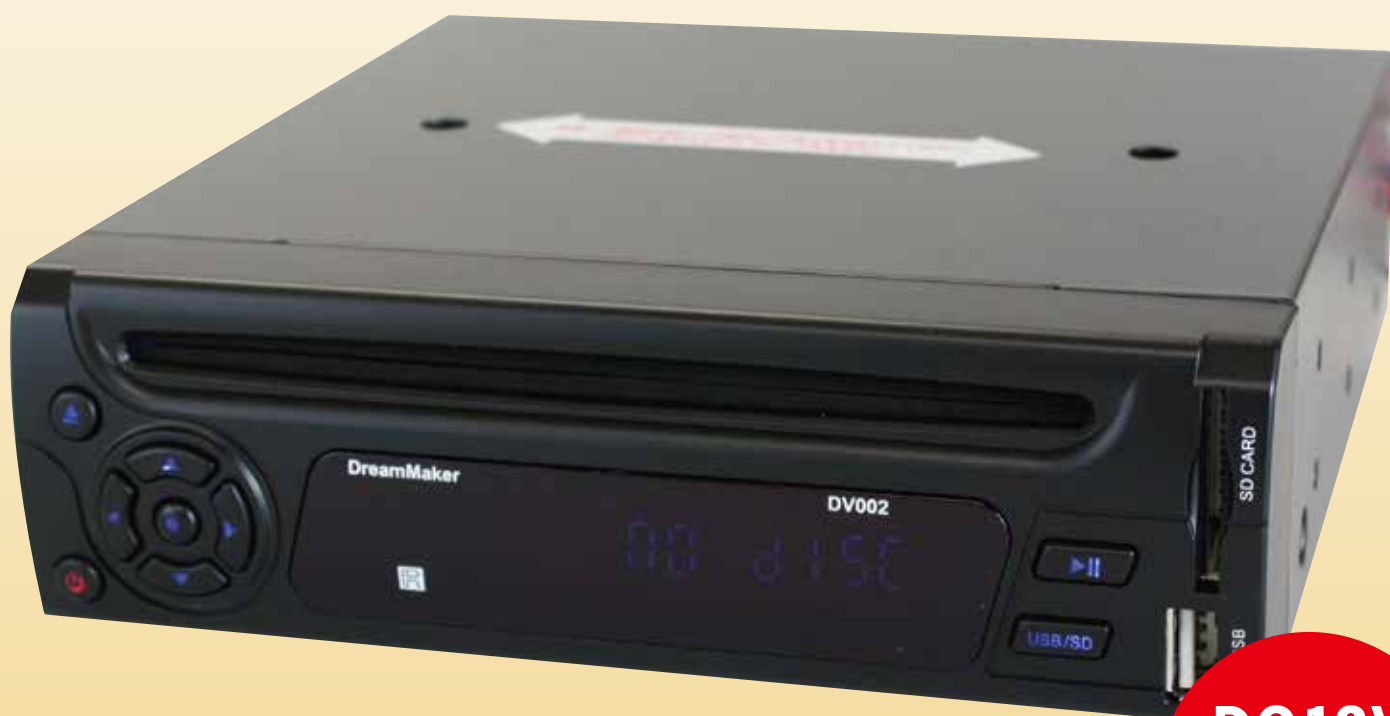
DVD プレーヤー DV002